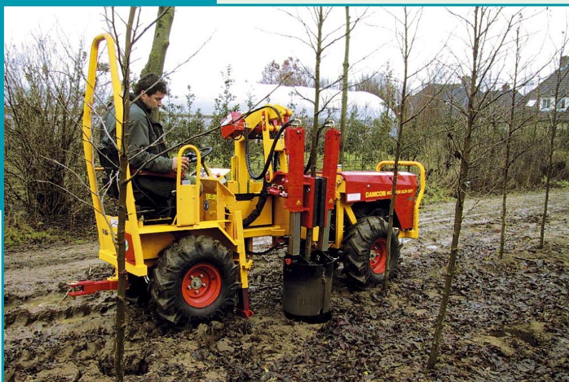
KLR 501 ZR

Arracheuse pour plantes de motte automotrice