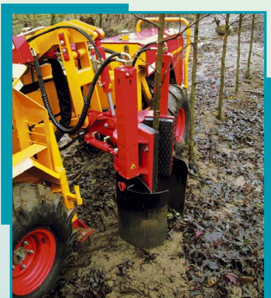
KLR 501 ZR